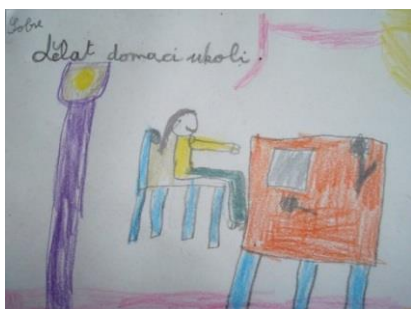
Stanovujeme si školní pravidla, 2011