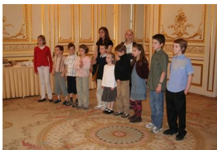
První předávání vysvědčení žákům, kteří složili rozdílové zkoušky, na ambasádě ČR v Paříži