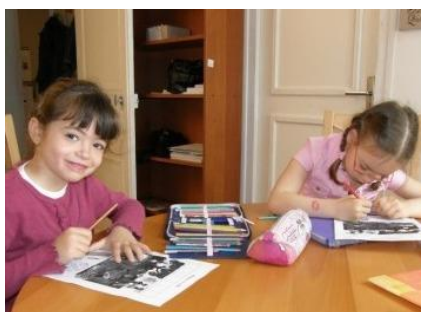
Školní výuka, r. 2009