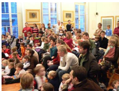
Vánoční besídka v roce 2003