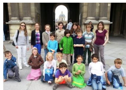
Mořeplavba na závěr roku 2012-13