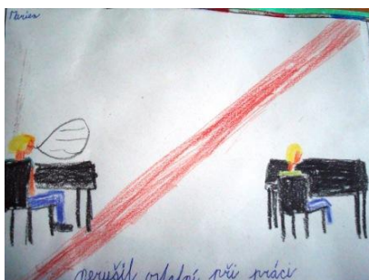
Stanovujeme si školní pravidla, 2011