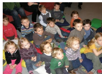
Předškoláků přibývá, r.2009