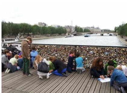
Mořeplavba na závěr roku 2012-13