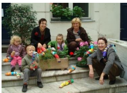
První podzimní tábor v r. 2009