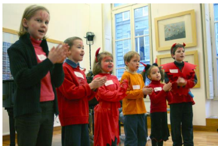
Vánoční besídka v roce 2003

Ohlédněme se zpět prostřednictvím fotografií.