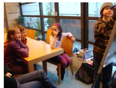
Začátky školní výuky (sobotní)