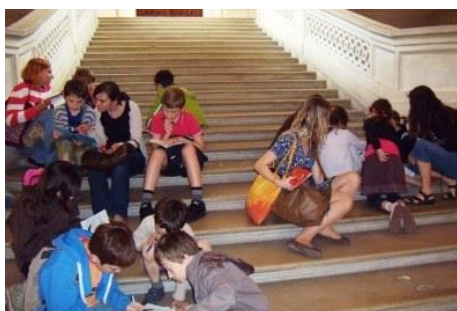
V Musée des Arts et Métiers, 2011- 12