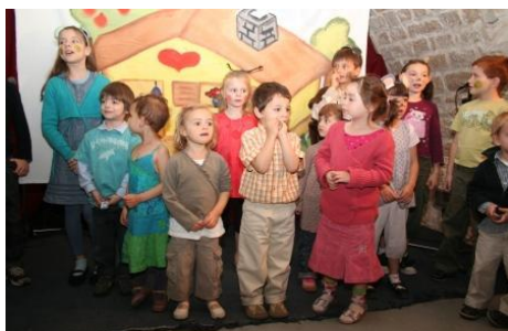
Představení na konci roku 2007/08