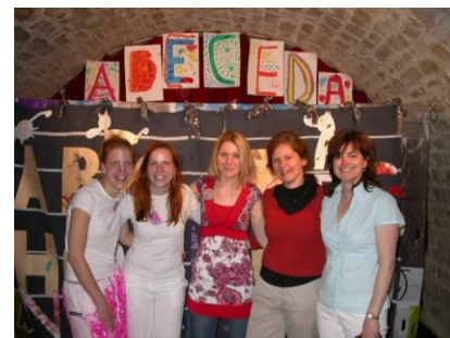
Tým školního roku 2006/2007